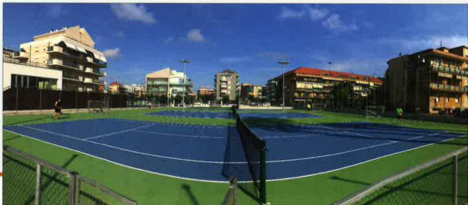
In alto a sinistra, il manto in Mapecoat TNS realizzato da Mapei per il campo da tennis del Lido di Milano.

Il piano seminterrato ospita gli spogliatoi oltre ad una sala polifunzionale e servizi igienici predisposti per disabili. All'esterno ha trovato posto un altro locale servizi per giocatori e pubblico che così, per usufruirne, non dovranno entrare nell'edificio. Il progetto è dello Studio Romano Associati.